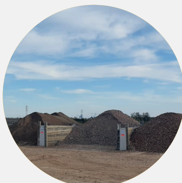
REVALORISATION DES MATÉRIAUX